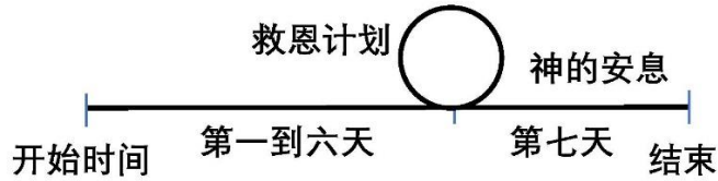
图二: 救恩计划的时间示意图