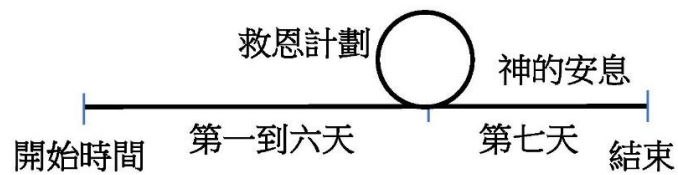
圖二: 救恩計劃的時間示意圖

圓。因為當初亞當吃了分別知識善惡樹上的果子，就有了圓，圓的大小就代表救恩計劃所需的時間，我們不知道圓的大小，只有神知道，祂是全知的。